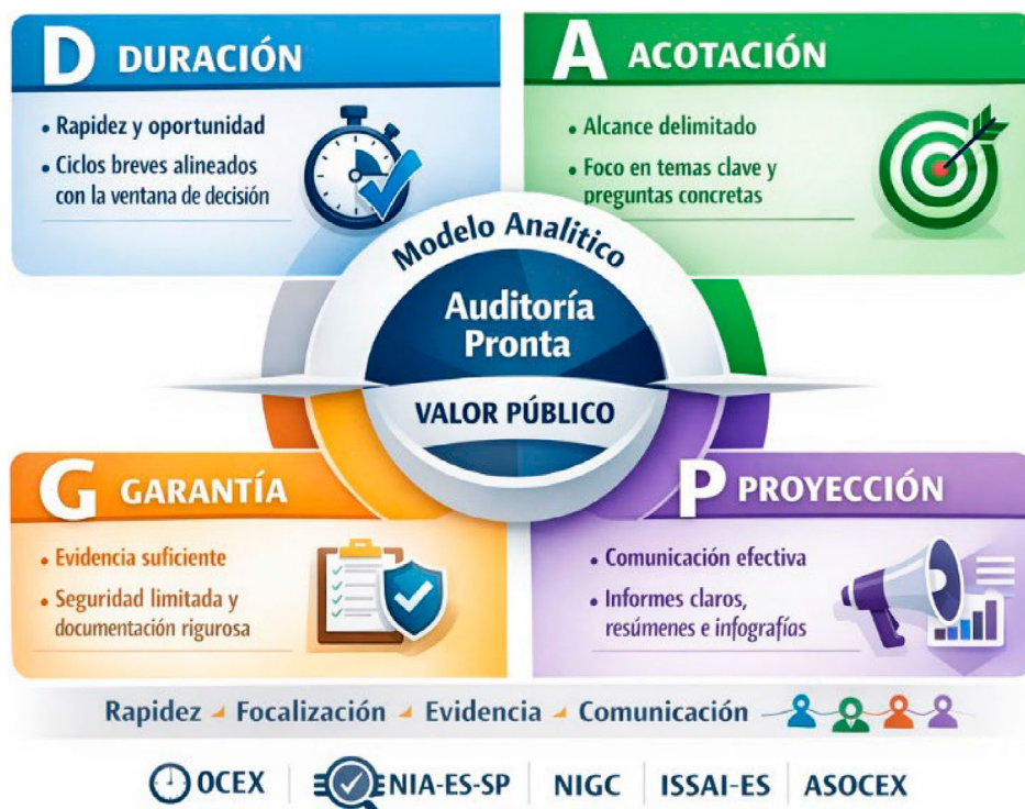
Figura 1. Modelo Analítico DAGP y sus cuatro dimensiones (Duración, Acotación, Garantía y Proyección).

La Proyección mide la capacidad del informe para influir en decisiones institucionales mediante claridad expositiva, accesibilidad y utilidad operativa.