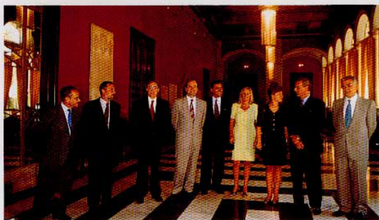
Presidente y consejeros de la Cámara de Cuentas con los presidentes de la Junta de Andalucía y del Parlamento andaluz.