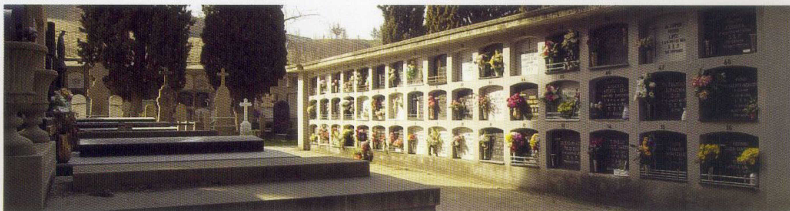
TABLA 3. SERVICIO DE CREMACIÓN (COSTES DIRECTOS)